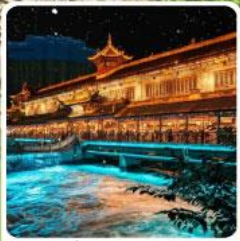
Blue Tears สะพานหนานเจียว