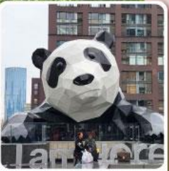
แพนด้าปิ่นตัก IFS