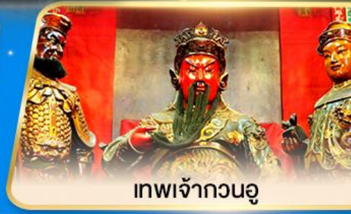
เทพเจ้ากวนอู