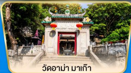
วัดอามา มาเก๊า