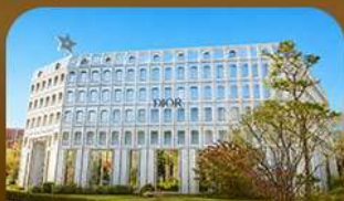
ชานซองซู