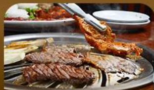
เมนูย่างสไตล์เกาหลี