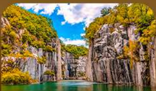
เขาดงตึงปะเมืองโพซอน

คามหาไม้เปลี่ยนสีสุดโรแมนติก ชมวิวบึงเปิดหลากสีจากสะพานแวงรูปตัว Y แห่งเมืองโพซอน สัมผัสความงดงามของโพซอนอาร์ทวอล์ก • เดินเล่นท่ามกลางต้นแปะก๊วยและเมเปิ้ลในพระราชวังเคียงบกกรุงโซล ชมหมู่บ้านอันอบอุ่นกลางบรรยากาศชิวๆ และปิดท้ายด้วยทุ่งหญ้าสีทอง ณ สวนฮานิล แลนด์มาร์กยอดนิยมของกรุงโซล ในช่วงฤดูไม้เปลี่ยนสีที่สวยงามที่สุด