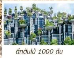
ตึกต้นไม้ 1000 ต้น