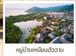
หมู่บ้านเหนียนฮิววาน

📦 โหลด 23 KG. x1 ทั้งไป - กลับ ✓ พรีเมียมทิวทัศน์ ✓ ไม่เข้าร้านรัฐบาล ✓ ทิวทัศน์แปลก ✓ รวมค่าเข้าชมตามที่ตามโปรแกรม