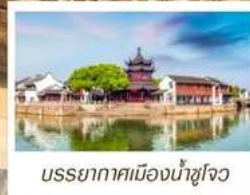
บรรยากาศเมืองน้ำซูโจว