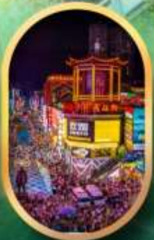
ถนนคนเดินซิงสวู่