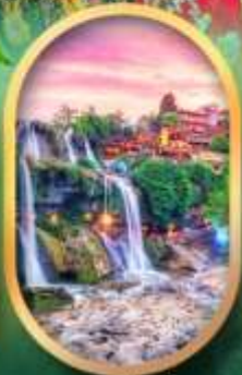
ฟูหลงเจิ้นน้ำตก