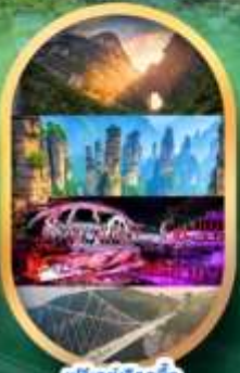
ฟรีคีย์เลือกซื้อ Option เสริม