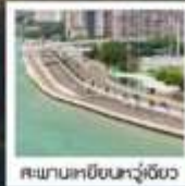
สะพานเหยียนหัวเจียว