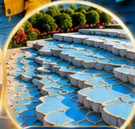
ปามุกคาล์ Pamukkale