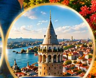
หอคอยกาลาตา Galata Tower