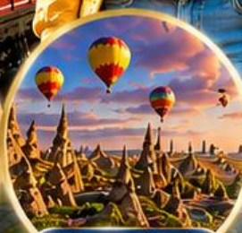
เมืองคัปปาโดเกีย Cappadocia