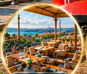
Seven Hills Cafe ชมวิว อิสตันบูล