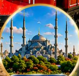
สุเหร่าสีน้ำเงิน Blue Mosque