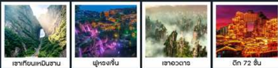
เขากิยอนเหมินซาน