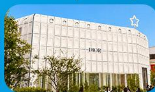
บรักคินกาซึ