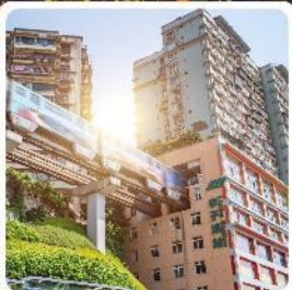
รถไฟฟ้าลอดตึก

ไฮไลท์! เช็ควิวตึกเก๋ๆ แลนด์มาร์คดังของวงซิ่ง ชมรถไฟฟ้าทะลุตึก อลังการแสงสีที่หงหยาดิ่ง