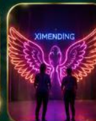
จุดเช็คอินสุดฮิต