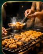
สตรีทฟู้ดชื่อดัง