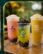
เครื่องดื่มยอดนิยม