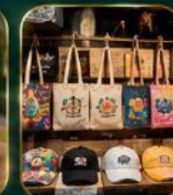
ของฝากเก๋ ๆ