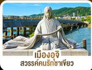
เมืองอิจิ สวรรค์คนรักชาเขียว