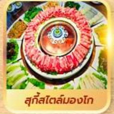
สุกีสไตล์มองโก