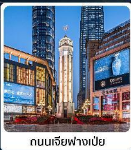
ถนนเจียฟางเป่ย์