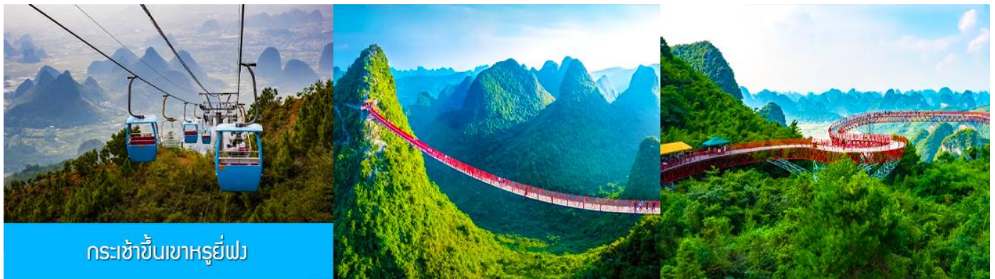
กระเช้าขึ้นเขาหรูยี่ฟง