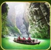
ล่องเรือแม่น้ำไตติงกุฮิว