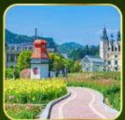
สวน Alice's Garden