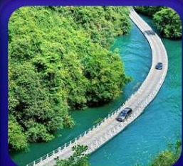
“ หุบเขาสิงโต ซื่อจื่อกวน ”