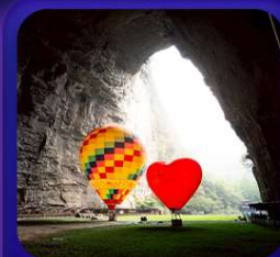
“ ถ้าถึงหลง ”