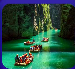
“ ผิงซานแกรนด์แคนยอน ”

เที่ยวจีน 2 มณฑล เสฉวน+หูเป่ย์ • ถ้าถึงหลง • หุบเขาสิงโต ซื่อจื่อกวน ล่องเรือมังกรกังส่วยชมวิวยามค่ำคืน • ผิงซานแกรนด์แคนยอน (รวมล่องเรือ) หงหยาดัง • จุดชมรถไฟฟ้าทะลุติ๊ก • ตึกตะเทียบ • สือปาตี • หลงเหมินฮ่าว