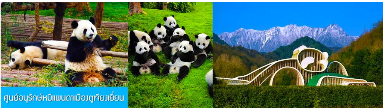
ศูนย์อนุรักษ์หมีแพนด้าเมืองตูเจียงเยียน