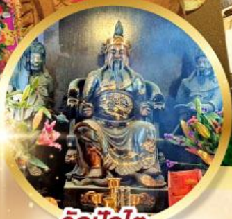
วัดปักไค

เสริมโชคลาภนำความรุ่งเรือง ทุกด้านของชีวิต