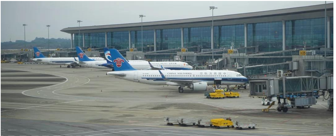
2UCKG-CZ005 บินตรงฉงชิ่ง ฟรีคอม ฟรีเดย์ สนุกสุดคุ้ม มหานครแปดมิติ 5 วัน 3 คืน โดยสายการบิน ไชน่า เซาเทิร์น (CZ)

00.30 น. ออกเดินทางจาก ท่าอากาศยานสุวรรณภูมิ อาคาร สู่ สนามบินฉงชิ่งเจียงเป่ย์ โดยสายการบิน ไชน่า เซาเทิร์น เที่ยวบินที่ CZ2362 05.00 น. เดินทางถึง ท่าอากาศยานนานาชาติสนามบินฉงชิ่ง เจียงเป่ย์ เมืองฉงชิ่ง มหานครที่ถูกสร้างขึ้นโดยทำหายทุกกฎเกณฑ์ของแรงโน้มถ่วงและภูมิศาสตร์ "เมืองภูเขา" ที่เติบโตและซ้อนทับกันเป็นชั้นๆ ตามหุบเขาและริมแม่น้ำ จนได้รับสมญานามสมัยใหม่ว่าเป็น "มหานคร 3 มิติสุดมหัศจรรย์" เมืองที่ท่านจะรู้สึกเหมือนหลุดเข้าไปในฉากภาพยนตร์ไซไฟ ที่ซึ่งชั้น 1 ของตึกหนึ่งอาจเชื่อมต่อกับชั้น 20 ของตึกข้างๆ, ที่ที่ท่านจะได้เห็นรถไฟฟ้าวิ่งทะลุกลางตึกอพาร์ทเมนต์, และที่ที่ Google Maps อาจต้องยอมแพ้ให้กับความซับซ้อนของถนนหนทางที่สร้างทับกันไปมาถึง 5 ระดับ จากนั้นนำท่านผ่านขั้นตอนตรวจคนเข้าเมือง รับกระเป๋าสัมภาระแล้ว นำท่านออกเดินทางเข้ารับประทานอาหารเช้า