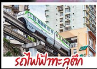
รถไฟฟ้าทะเลสาบ