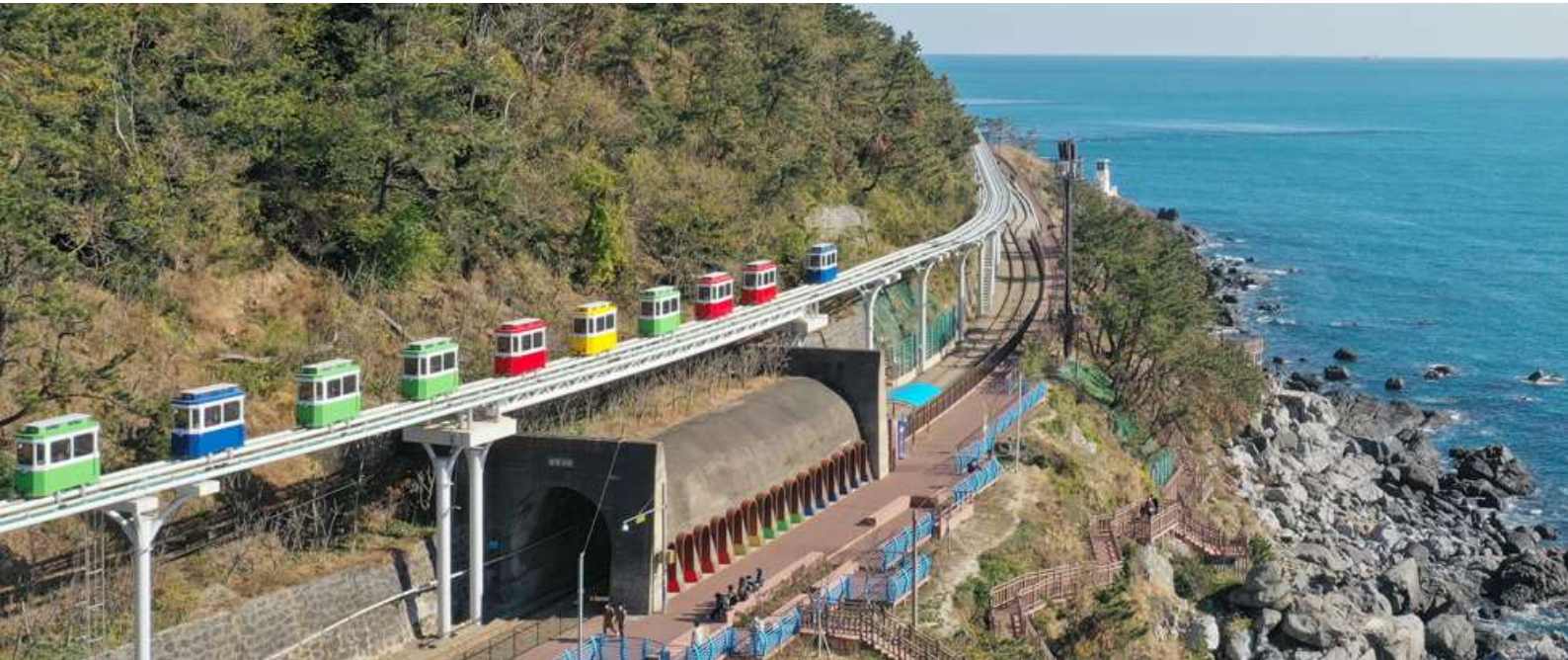
โดยเฉพาะช่วงเย็นที่พระอาทิตย์ตกดิน จะเห็นวิวที่โรแมนติกเป็นอย่างมาก

แวะเดินเล่น ถนนหาดแฮอนแด หนึ่งในชายหาดที่สวยงามและมีชื่อเสียงที่สุด ตั้งอยู่ใจกลางเมืองปูซาน ด้วยหาดทรายขาวละเอียด ทะเลสีครามใส และวิวเมืองที่สวยงาม ทำให้หาดแฮอนแดเป็นจุดหมายปลายทางยอดนิยมของนักท่องเที่ยวทั้งชาวเกาหลีและชาวต่างชาติ จากชายหาดสามารถมองเห็นตึกระฟ้าและวิวเมืองปูซานได้อย่างชัดเจน