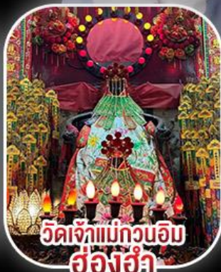
วัดเจ้าแม่กวนอิม ฮ่องฮำ