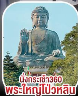
นั่งกระเช้า360 พระใหญ่โป่วหลิน