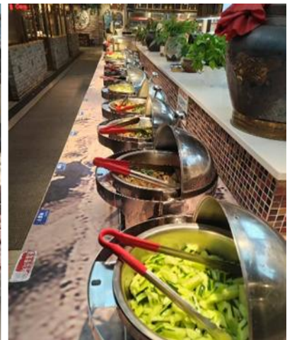
ที่พัก REZEN SUNGO HOTEL หรือระดับเทียบเท่า 4 ดาว(มาตรฐานจีน)

G01CNXCKG-PN001 เชียงใหม่ ฉงชิ่ง เกินไปปะ 3 วัน 2 คืน (PN)