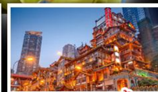
ตลาดแดงเขย่าตัง