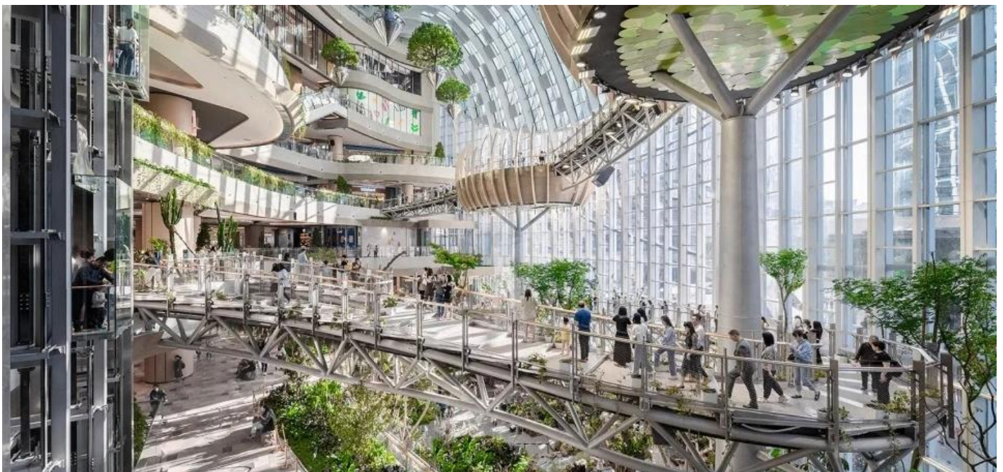
บ่าย นำท่านเช็คคิน ณ ห้าง THE RING MALL นิยามใหม่ของศูนย์การค้า ที่ซึ่งจินตนาการและความล้ำสมัยได้ก้าวไปอีกขั้น ถึงขั้นที่ท่านสามารถเดินช้อปปิ้งไปพร้อมกับการชมความยิ่งใหญ่ของธรรมชาติ หัวใจของสถานที่แห่งนี้คือ "ป่าแนวตั้งในร่มขนาดมหึมา" ที่สูงตระหง่านถึง 42 เมตรใจกลางตัวอาคาร จินตนาการถึงการเดินอยู่บนสะพานแขวนที่ทอดผ่านม่านน้ำตกซึ่งไหลลงมาจากชั้นบนสุด สองข้างทางคือพืชพรรณเขตร้อนนานาชนิดที่เขียวขุ่มราวกับป่าดิบชื้นจริงๆ แสงธรรมชาติที่ส่องลงมาจากหลังคากระจกยิ่งทำให้ที่นี่ดู