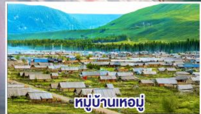
หมู่บ้านห่อมุ