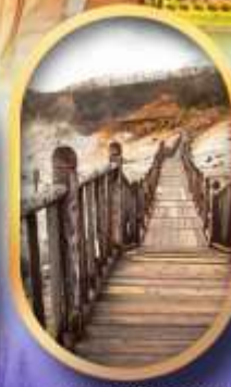
หุบเขาจิกุกดาบิ