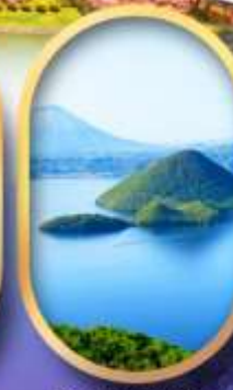
อิวะทะเลสาบโทยะ