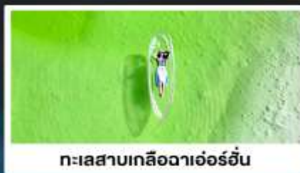
ทะเลสาบเกลือดาเอ๋อร์อัน