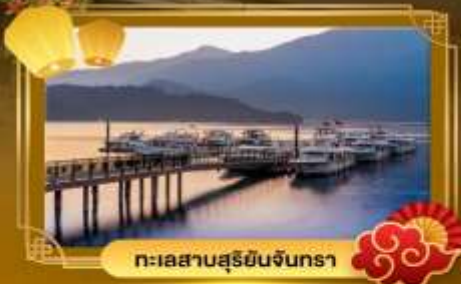
ทะเลสาบสุริยจันทร์