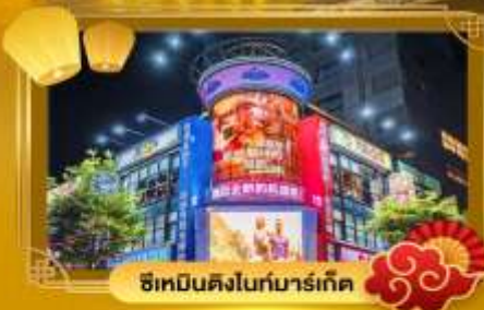
ช้อปปิ้งในท์มาร์เก็ต