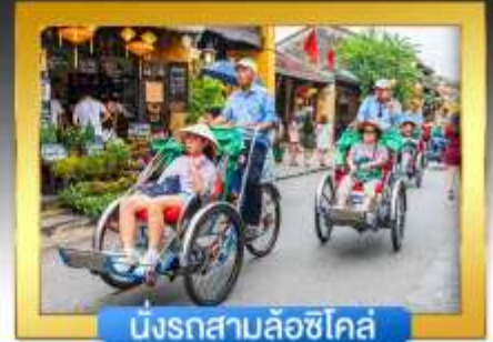
นั่งรถสามล้อซีโคล์