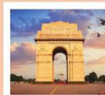
♥♦♦ India Gate