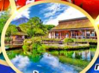
หมู่บ้านน้ำใสโอชิโนะฮัทโก