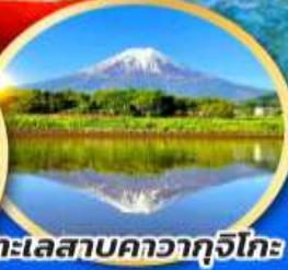
ทะเลสาบคาวากูจิโกะ