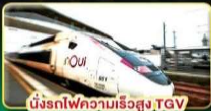
นั่งรถไฟความเร็วสูง TGV