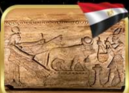
สุสานใต้ดินอเล็กซานเดรีย

เข้าชมพิพิธภัณฑ์อียิปต์แห่งใหม่ (GRAND EGYPTIAN MUSEUM)