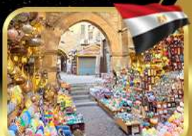
ตลาดชานเอลคาลิลี