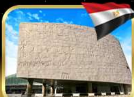
ห้องสมุดอเล็กซานเดรีย