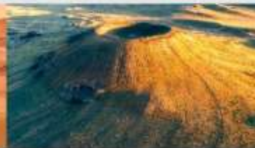
ภูเขาไฟอูลันฮาตา

*ทางบริษัทฯ ขอสงวนสิทธิ์ในการสลับโปรแกรมทัวร์ตามความเหมาะสมขึ้นอยู่กับสถานการณ์หน้างาน โดยคำนึงถึงผลประโยชน์ของลูกค้าเป็นสำคัญ