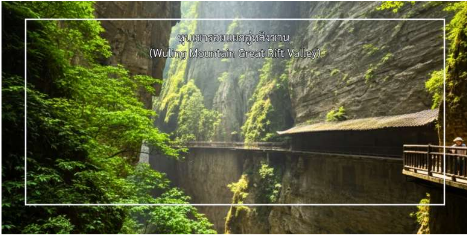
หุบเขารอยแยกอู่หลิงซาน (Wuling Mountain Great Rift Valley)

แนวถ่ายภาพ ฐานวิศวกรรมนิวเคลียร์ 816 (816 Nuclear Engineering Base) โครงการลับสุดยอดของจีนในยุค สงครามเย็น เป็นฐานใต้ดินขนาดมหึมาที่เจาะลึกเข้าไปในภูเขาใช้เวลาสร้าง 17 ปี แรงงานทหารกว่า 60,000 นาย มี อุโมงค์ยาวกว่า 20 กิโลเมตร ภายในมีห้องโถงที่ใหญ่ที่สุดสูงเท่าตึก 20 ชั้น หลังจากการยกเลิกโครงการ ฐานแห่งนี้ก็ถูก ปิดเป็นความลับนานหลายปี ก่อนที่จะได้รับการปลดความลับในปี 2002 และเปิดให้เป็นแหล่งท่องเที่ยวในปี 2010 ซึ่งไม่มีสารกัมมันตรังสี และเปิดให้เข้าชมความอลังการของวิศวกรรมการก่อสร้างใต้ดิน ที่ไม่เคยถูกใช้งานจริง สมควรแก่เวลานำท่านเดินทางกลับ ฉงชิ่ง (ใช้เวลาประมาณ 2.30 ชั่วโมง)