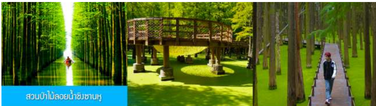
สวนป่าไผ่ลอยน้ำชิงชานหู

พักที่ โรงแรม Holiday Inn Express Hotel 4* หรือเทียบเท่าในนครเซี่ยงไฮ้