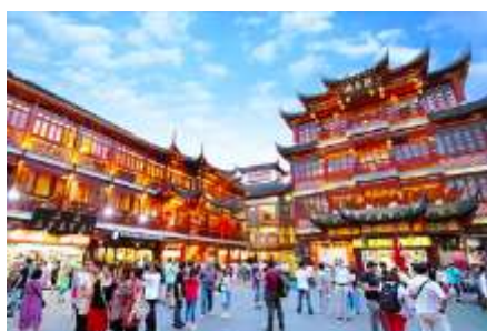
ตลาดร้อยปีเวินหวงเมี่ยว

พักที่ โรงแรม Holiday Inn Express Hotel 4* หรือเทียบเท่าในนครเซี่ยงไฮ้