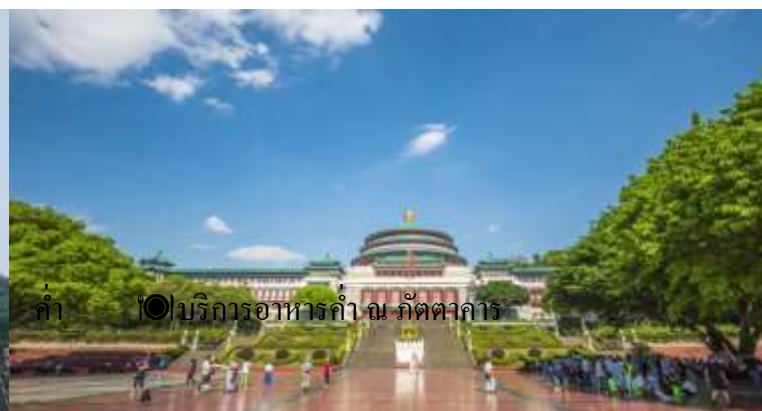
ค่ำ ☉ บริการอาหารค่ำ ณ ภัตตาคาร