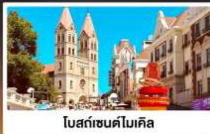
โบสถ์เซนต์ไมเคิล