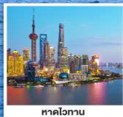
หาดไวทาน