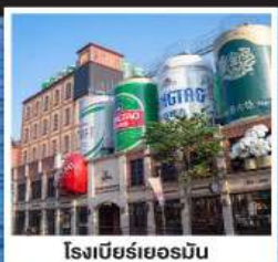
โรงเบียร์เยอรมัน