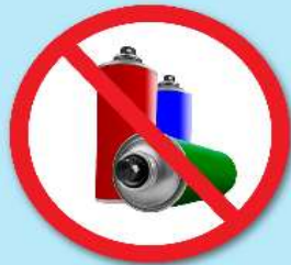
ขวดสเปรย์