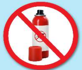
ขวดน้ำยา ฆ่าแมลง