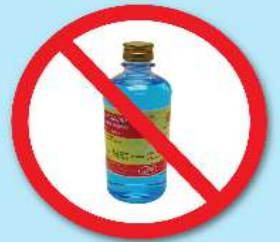
ขวดแอลกอฮอล์