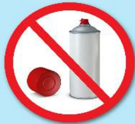
กระป๋องสเปรย์