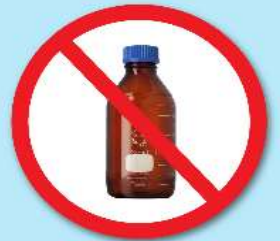
ขวดสารเคมี