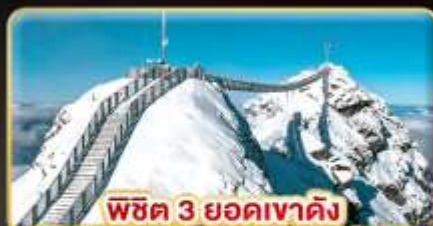
พิชิต 3 ยอดเขาดัง Rigi / Schilthorn / Glacier 3000