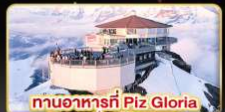
ทานอาหารที่ Piz Gloria ภัตตาคารที่หมุนได้ 360 องศา