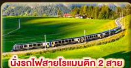
นั่งรถไฟสายโรแมนติก 2 สาย Golden Pass / Luzern Interlaken Express

📅 เดินทาง: 5-12 เม.ย. | 31 พ.ค.-7 มิ.ย. 69