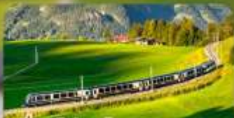
นั่งรถไฟสายโรเบินดิก 3 สาย Golden Pass / Luzern Interlaken Express / Gornergrat