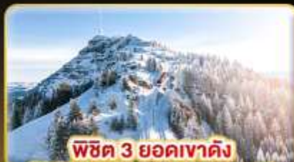
พีชิต 3 ยอดเขาดัง Rigi / Schilthorn / Gornergrat