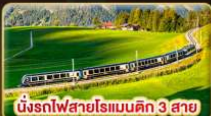
นั่งรถไฟสายโรเมนติก 3 สาย Golden Pass / Luzern Interlaken Express / Gornergrat

📅 เดินทาง: 5-12 เม.ย. | 31 พ.ค.-7 มิ.ย. 69