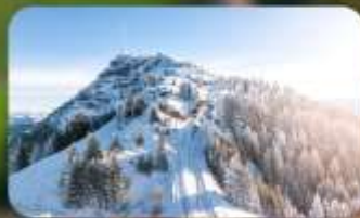
พิชิต 3 ยอดเขาดัง Rigi / Schilthorn / Gornergrat