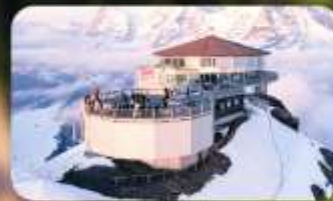
ทานอาหารที่ Piz Gloria ภัตตาคารที่หมุนได้ 360 องศา