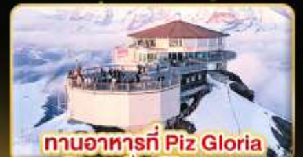
ทานอาหารที่ Piz Gloria ภัตตาคารที่มุมได้ 360 องศา